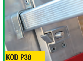
Specjalny element zabezpieczający przed rozłączeniem. Special unhook safety device.