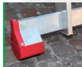
Nowa podstawa stabilizująca New stabilizer base.