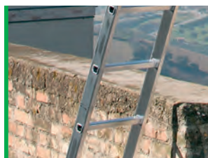
Szczeble 30x30 cm. Rungs 30x30 cm.

50.000 opór/cykli resistance/cycles EN 131-2: 2018 UZYTEK PROFESJONALNY PROFESSIONAL USE