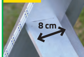
Stopnie o szerokości 8 cm. 8 cm wide rungs