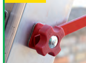
Specjalne zabezpieczenie zapobiega rozsunięciu. Special anti-opening device.