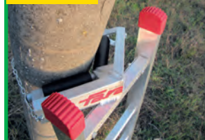
Opcjonalne zabezpieczenie. Pole support cod. P8.