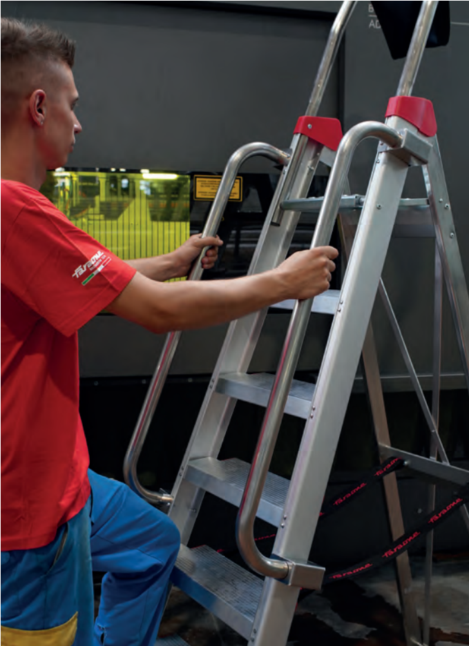
Uniwersalna w każdej sytuacji zapewnia stabilność i bezpieczeństwo. Versatile in any situation, it guarantees stability and safety.