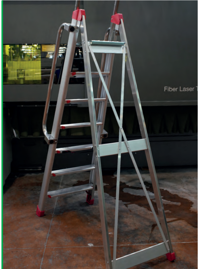
Krzyżowy system stabilizacji o większej sztywności i większym bezpieczeństwie drabiny. Cross-stabilising system for increased stiffness and safety.