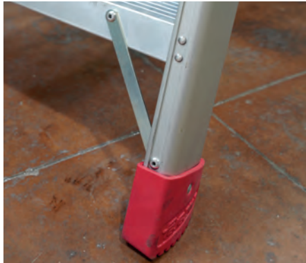
Większa stabilność dzięki poprzeczkom wzmacniającym w narożnikach. Increased stability with reinforced crossbars on the corners.