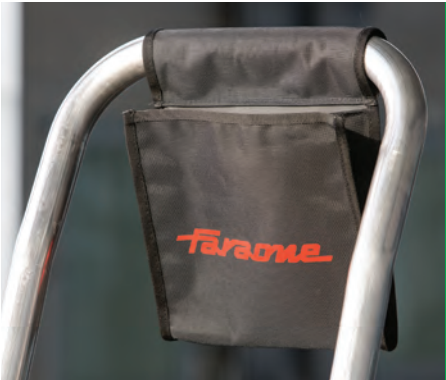
Wygodna i solidna kieszeń na narzędzia. Practical tool bag.