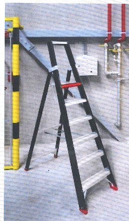
TGB 3, 4, 5, 6, 7, 8, 10, 12