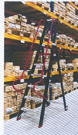
TME 6, 7, 9, 11

Opgesteld Drawn-up 27-10-2011 Ausstellungsdatum Établi le