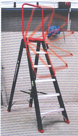
TDO 2, 3, 4, 5, 6, 7, 8, 10, 12