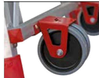
Absolutna stabilność podczas pracy, wygodne i szybkie przemieszczanie. Absolute stability while working and easy to move.