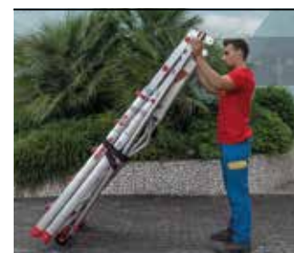
Kompaktowa, lekka i łatwa do złożenia. Compact size for easy transportation.