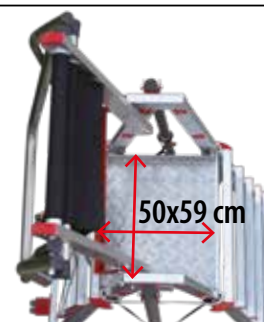
Bezpieczna platforma robocza. Non-slip working platform.