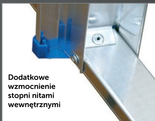
Dodatkowe wzmocnienie stopni nitami wewnętrznymi